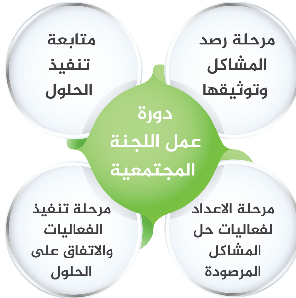
شكل يوضح مراحل عمل اللجان المجتمعية