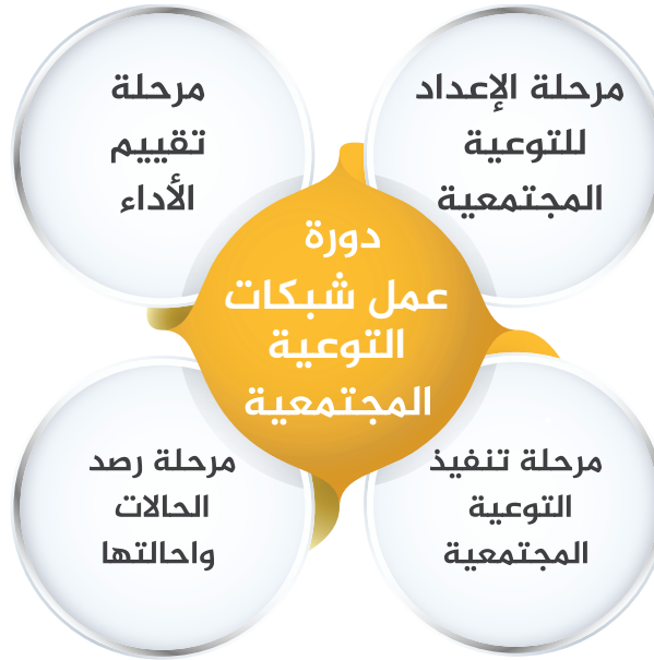
شكل يوضح مراحل عمل شبكات التوعية المجتمعية